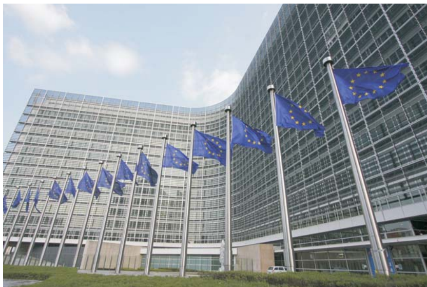
Gebäude der europäischen Kommission in Brüssel

Wenn man auf der Verpackung einer Energiesparlampe liest, dass diese nur 11 Watt verbraucht und genauso viel Licht abstrahlt wie eine 60-Watt-Glühbirne, beginnt man als Normalverbraucher zu rechnen und nimmt den höheren Preis in Kauf. Ob dieser einfache Vergleich wirklich stimmt, darf bezweifelt werden.