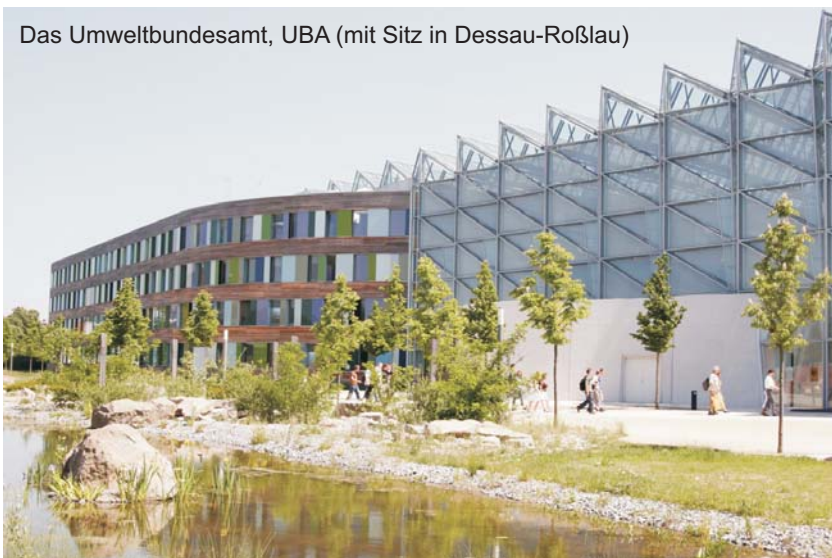
Das Umweltbundesamt, UBA (mit Sitz in Dessau-Roßlau)

Es entsteht der fatale Eindruck, dass das UBA in der Rolle des abwartenden Zuschauers verharrt, während das Gesetz des Handelns bei den Lampenherstellern liegt, die, anscheinend einer langfristigen Strategie folgend, künftige Absatzmärkte sichern. Gut ins Bild passt die jüngst erfolgte Ankündigung der Leuchtmittel-Fabrikanten,