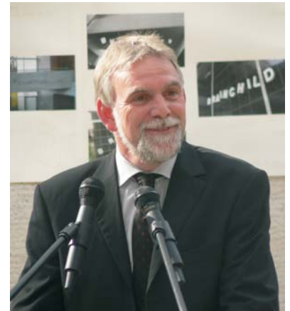
Jochen Flasbarth, derzeitiger Präsident des Umweltbundesamtes.

Anscheinend peinlich berührt von der eigenen Trägheit, reagierte das Amt in der gewohnten Art. Es schob die Verantwortung anderen zu. Der Chef der Behörde, Jochen Flasbarth (Foto rechts), forderte die Lampenhersteller auf, ihre Produkte so sicher zu machen, dass kein Quecksilber austreten könne, zum Beispiel durch eine zusätzliche Ummantelung der eigentlichen Leuchtröhre. „Die richtige und notwendige Energieeinsparung von bis zu 80 Prozent gegenüber Glühbirnen muss einhergehen mit sicheren Produkten, von denen keine vermeidbaren Gesundheitsrisiken ausgehen“, meinte Flasbarth. Im selben Artikel verlangte Gerd Billen, der Sprecher des Verbraucherzentrale