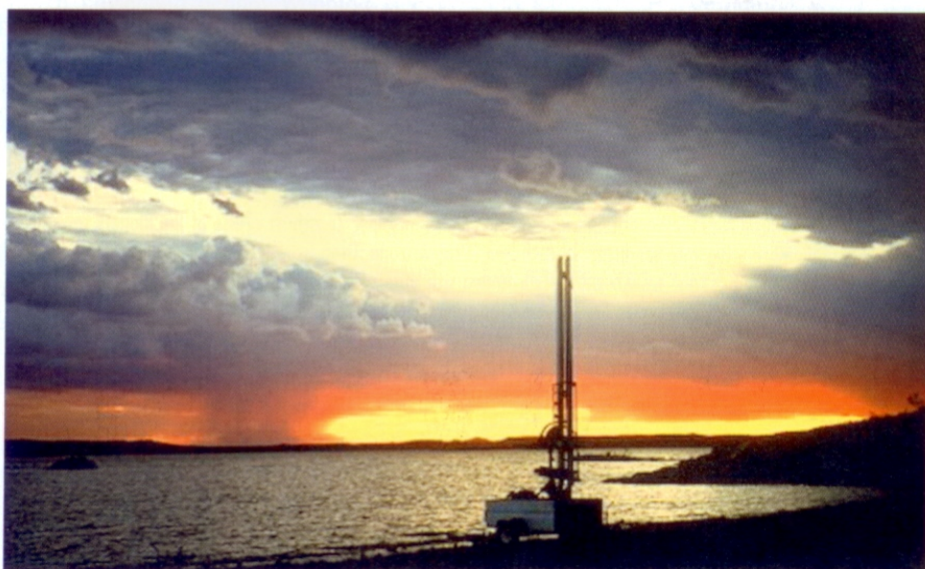
Namibia 1993 (unten). Weitere Aufnahme von James DeMeos Experimenten.