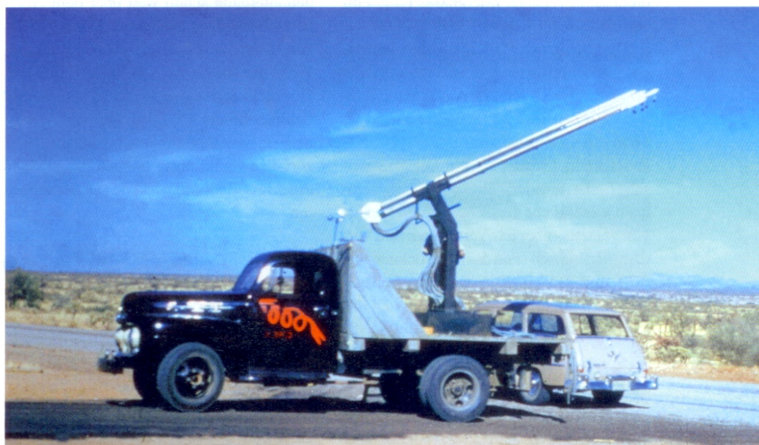
«Himmels-Akupunktur-Gerät». Wilhelm Reichs «Cloudbuster».

Auch an Ort und Stelle bilden sich keine strukturierten Wolken, so dass die Niederschläge gänzlich ausbleiben. Wird dieser Zustand chronisch, dann entsteht eine Dür-